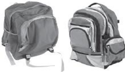
pencil cases / school bags