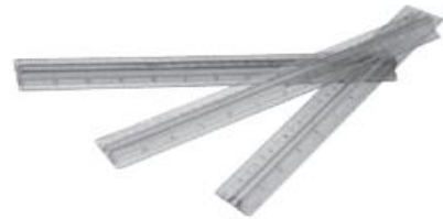
rubbers / rulers