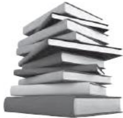
books / pens