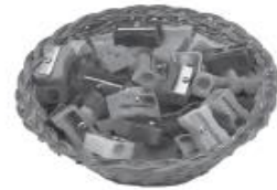
pencils / sharpeners