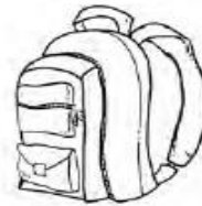
pencil case / school bag