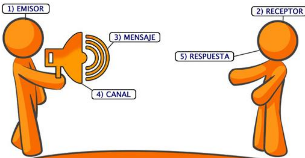
(Elementos de la comunicación.)

Se trata de un proceso dinámico de ida y vuelta y que involucra diversas competencias.